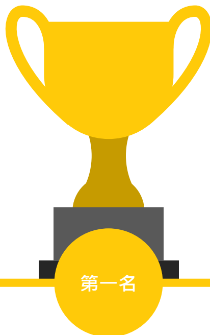
仁濟醫院蔡衍濤小學