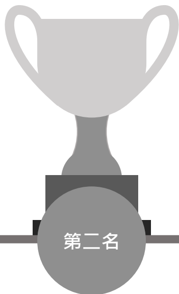
油麻地天主教小學(海泓道)