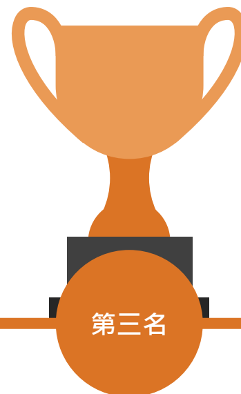
天主教總堂區學校