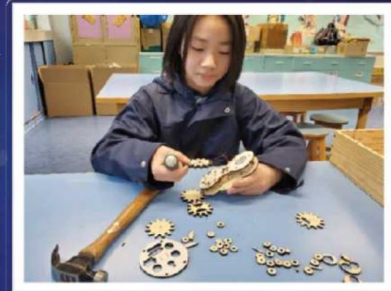
學生將配件分類後 將齒輪組合在一起