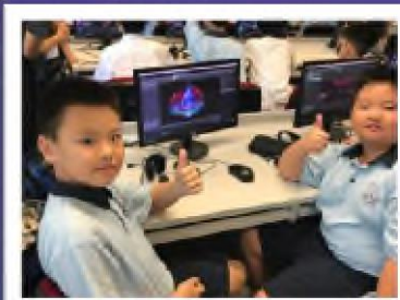
不斷設計和改良 作品才會完美