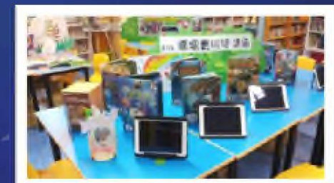
圖書館AR擴增實境閱讀區