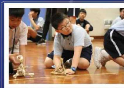
我們的羅馬炮架最厲害！