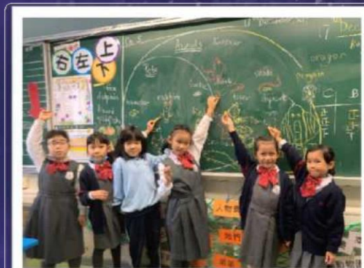
一年級同學透過高階思維的技巧愉快地學習英語