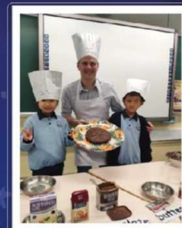
為配合英語主題故事外籍老師與全班同學一起焗製蛋糕