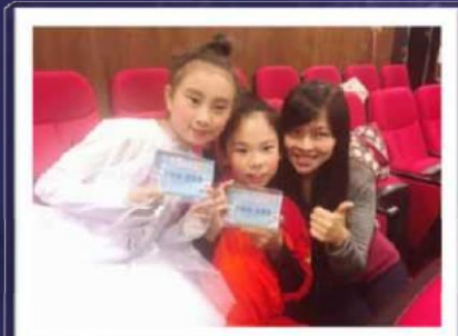
濕地劇場說故事比賽 表現出色 兩隊均獲優異獎