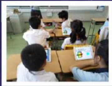
運用實物操作 加上電子學習元素進行立體圖形的探究