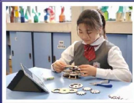
學生將配件分類後 將齒輪組合在一起