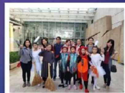
濕地劇場說故事比賽 家長老師生大合照