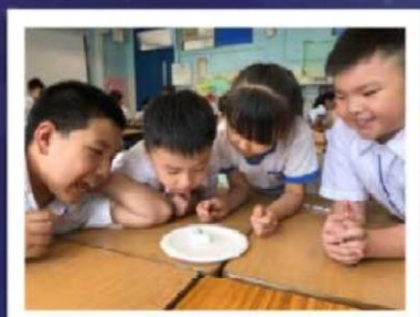
鐵釘為何會指出正確方向呢？