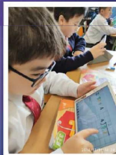
學生在Nearpod進行學習評估