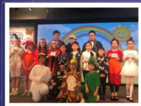
濕地劇場說故事比賽 參賽者造型大合照