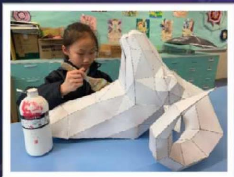
作品接近完成了 為作品上色