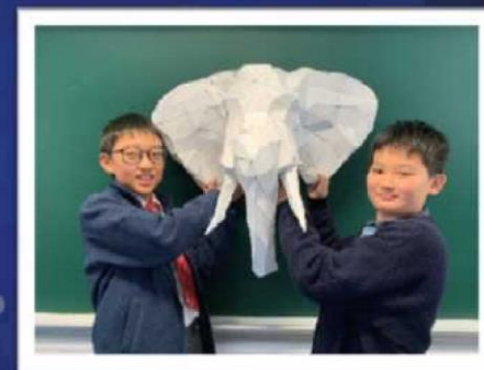
我們的作品完成了！