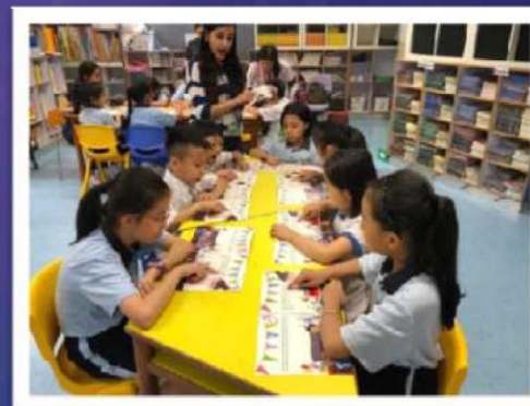
由外籍老師帶領學生分組朗讀英文故事