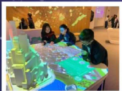
看！光影效果多有趣