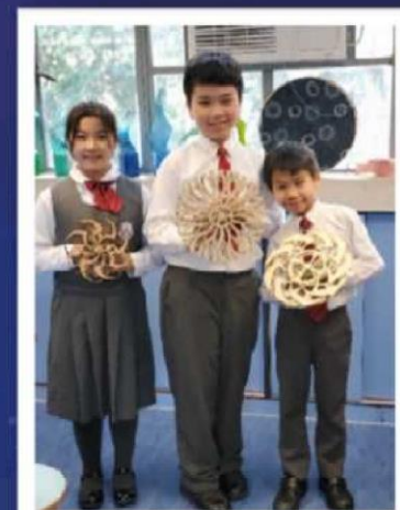
展示自己的製成品