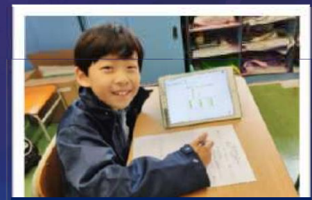
學生利用GeoGebra軟件 進行除法分物的程序