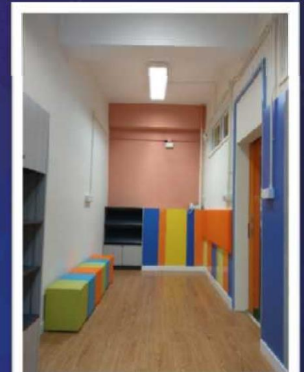
閱讀室佈置簡潔且色彩豐富 增添閱讀的樂趣