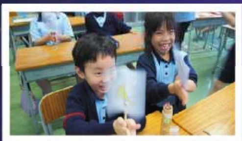
小鳥被抓到籠子裏呢！

本校透過常識科的多元化學習經歷，讓學生將課本的科學知識實踐，特色課程包括：光雕課程、STEM專題研習、創新發明比賽，讓他們「動手做」，透過觀察、預測、設計及驗證，從中學習有系統的科學探究，豐富學生的學習，強化學生共通能力。