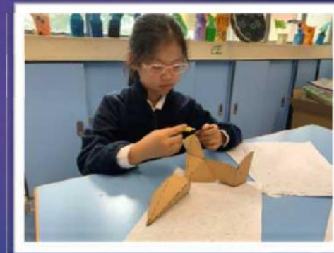
使用拼貼方式製作