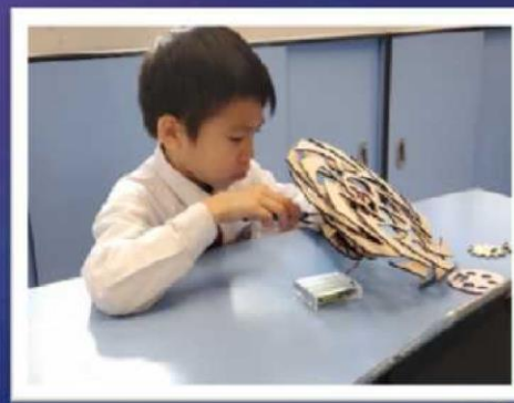
嘗試將摩打組裝在作品上