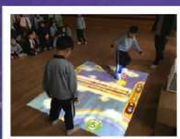
科技到校園—互動地板