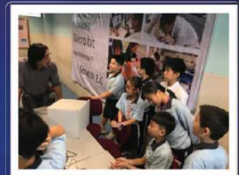
同學用心聆聽 才會明白科學原理