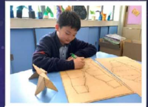
小心地將圖案切割出來

作品以藝術概念為主導，貫徹整個作品系列，而機械科技作用是加強和實踐學生的概念。動物的外型運用了立體幾何去展示，而非寫實外型，理由是幾何課題是學生的已有知識。在製作及組合的過程中，會不知不覺地培養學生對幾何的敏銳度，他們必須理解不同幾何圖形在什麼情況下才可連接合成。