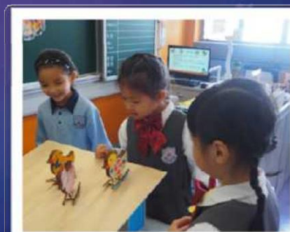
同學進行活動 同時學習科學原理