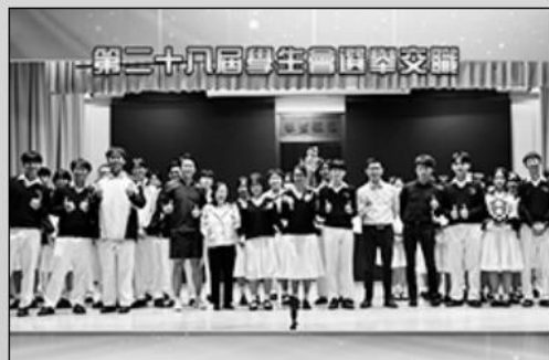
第二十八屆學生會選舉交職

10月21日的早會中進行了投票，結果由1號候選人Catalyst成功當選。我們期待Catalyst能夠