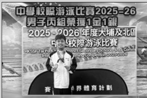
中學校際游泳比賽2025-26男子丙組榮獲1金1銀

10月21日的早會中進行了投票，結果由1號候選人Catalyst成功當選。我們期待Catalyst能夠