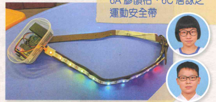
6A 廖韻怡、6C 唐詠之 運動安全帶

港人工作繁忙，很多時要等到晚上下班才有時間跑步做運動，但晚上燈色昏暗，容易發生意外，因此衍生了「運動安全帶」。其設有彩虹幻燈，用家可以掛在身上或腰上，讓其他路人或駕駛人士清楚看見，避免碰撞。另有重力傳感器的功能，如用家摔倒，蜂鳴器就會發出聲響，讓附近的人盡快幫忙。