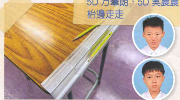
5D 方肇朗、5D 吳晨晨 枱邊走走

構思源於疫情期間學生枱上的透明板。只需將「枱邊走走」放在學生枱的三邊，當文具準備跌出枱面時，便會跌入「枱邊走走」的凹坑內，減少文具跌落地上的次數。此外，同學可把枱面的擦膠碎撥入坑內，待小息時拆下來拿去垃圾桶倒掉，避免直接撥落地下，減少工友姨姨的工作量。