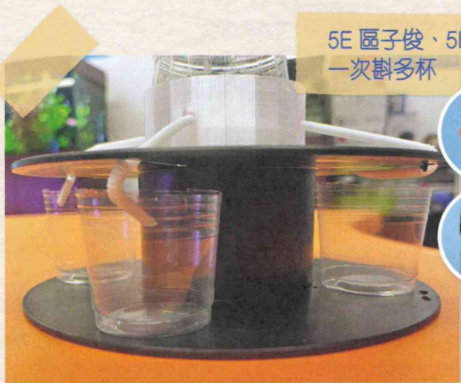
5E 區子俊、5E 鄧諾涵 一次斟多杯

實踐是創意教育中不可缺少的一環。仁濟醫院蔡衍濤小學由初小已加強「動手做」元素，於常識科把STEAM探究連結生活，讓學生在不同層面應用、分析和解構事物，藉此加強學生解難能力和創造力。同學的設計意念源於日常生活小難題，利用簡單的方法和物料來思考解決方案，反映出學生觀察力強，懂得在日常生活中發掘有趣的研究課題。科學可以很貼地，不一定要研究甚麼高端科技，從改善日常生活出發已是一個很好的課題，讓學生明白科學與生活其實息息相關。