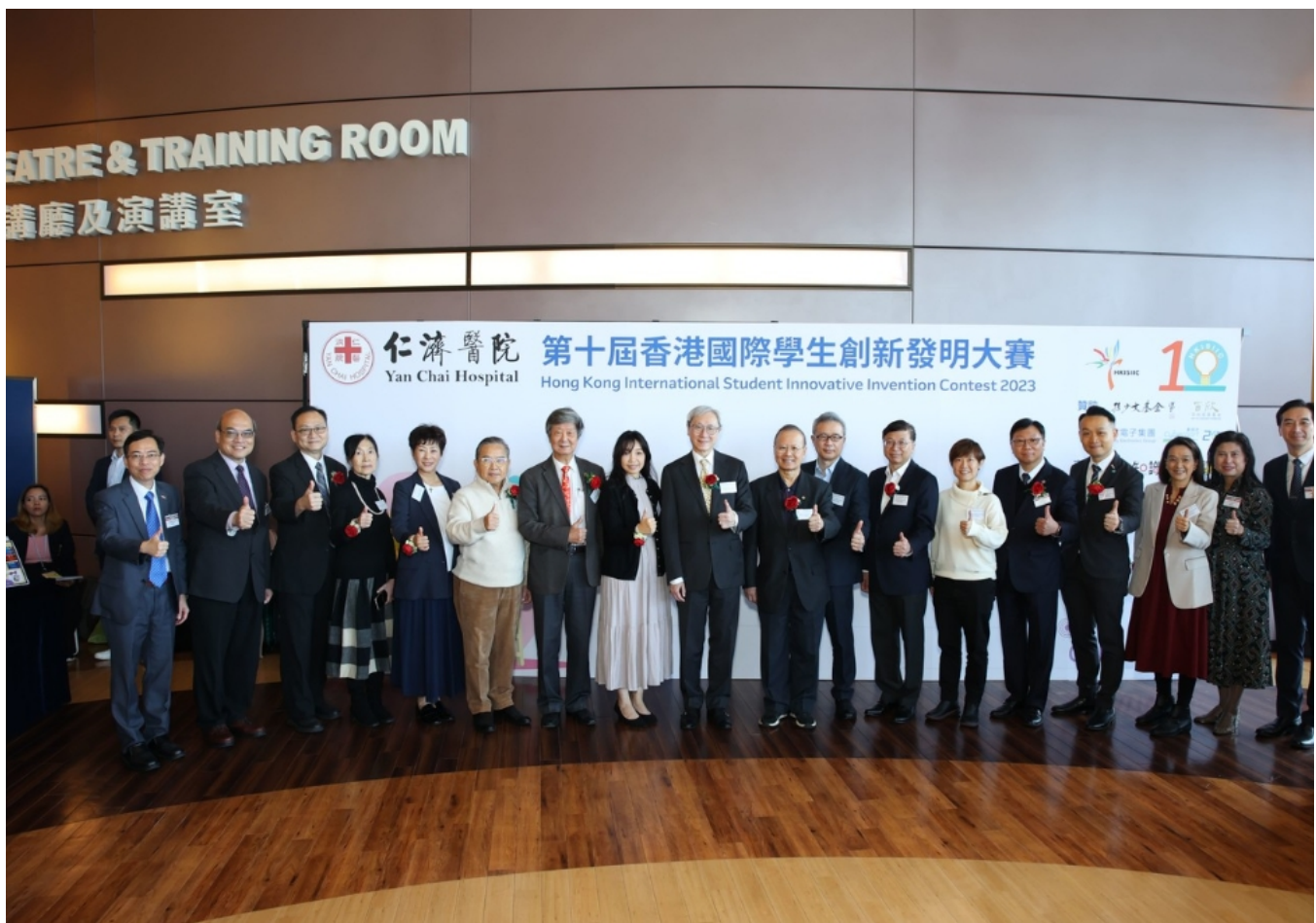
總評評審團與仁濟院屬中小學校長拍照留念

由仁濟醫院董事局主辦之“香港國際學生創新發明大賽”已踏入第十屆。12月16日，大賽總評暨頒獎典禮於數碼港隆重舉行，由教育局副秘書長女士蒞臨主禮，並與一眾嘉賓主持10周年亮燈儀式。